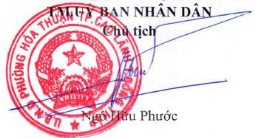
Ngô Hữu Phước